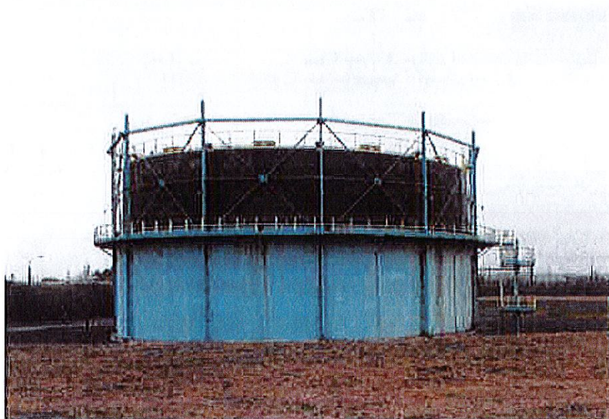
Istniejący zbiornik biogazu

Lokalizację zbiornika pokazano na planie zagospodarowania terenu.