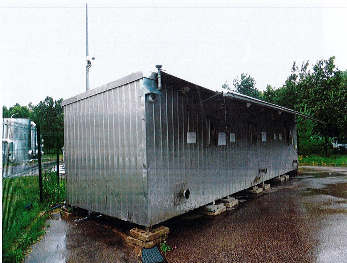
1. Kontenerowa stacja zlewna nieczystości ciekłych, rok budowy 2012