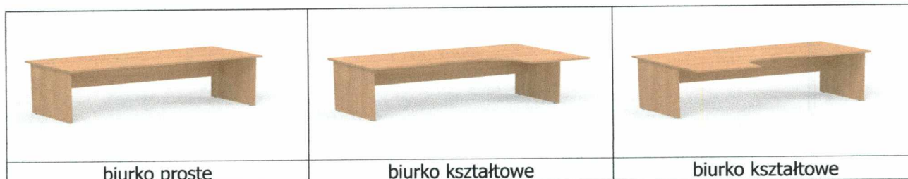
Rysunki poglądowe biurek płytowych

Blaty wykonane z płyty grubości 25 mm, krawędzie oklejone obrzeżem ABS grubości min. 2mm, korpus biurka z płyty laminowanej o grubości min. 18 mm, krawędzie oklejone obrzeżem ABS grubości min. 2mm, wyposażone w regulatory wysokości, blenda konstrukcyjna połączona z nogami za pomocą złącz mimośrodowych i kołków drewnianych.